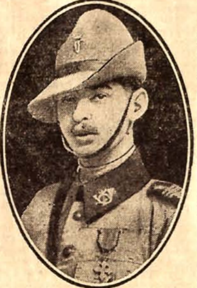
Le prince Carol

Bucarest, 27 Nov. — Les nouvelles du roi Ferdinand de Roumanie sont meilleures ce soir. Toutefois, l'état du souverain peut empirer d'une minute à l'autre. Il a exprimé le désir de revoir son fils, le prince Carol, avant de mourir.