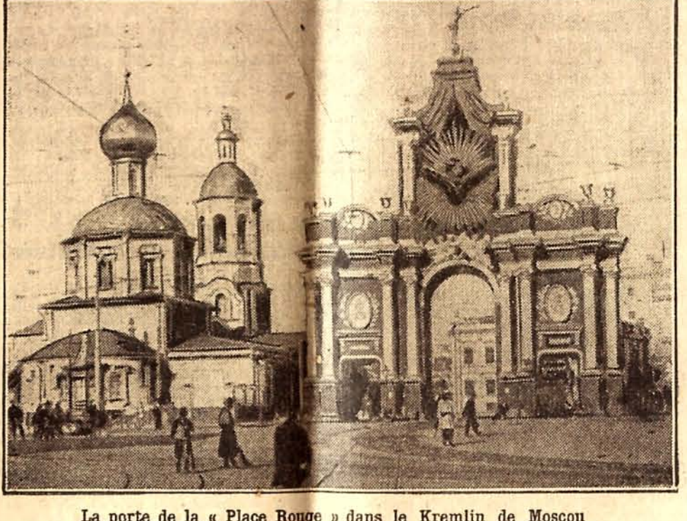
La porte de la « Place Rouge » dans le Kremlin de Moscou. C'est sur cette place, devant le monument aux morts de la Révolution, que doit, on le sait, être inhumé le dictateur bolcheviste.

Helsingfors, 24 Janvier. — On mande de Moscou :