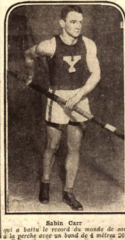
Sabin Carr qui a battu le record du monde de saut à la perche avec un bond de 4 mètres 267.